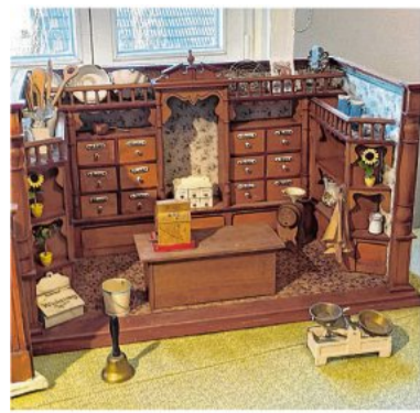
Die Ausstellung zeigt schöne Miniaturen.