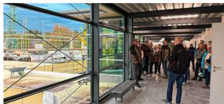
Investition in die Bildung: Haus 3 der Hornbergschule wird aktuell für insgesamt 9 Millionen Euro saniert und ungebaut.