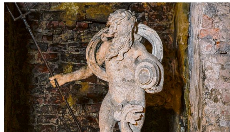
Die Statue des römischen Wassergotts Neptun. Die Figur trägt eine der Sauna angepasste Kleidung.

Zwischen 15 und 1 Uhr können die Sauna-Gäste in der entsprechend dekorierten und illuminierten Wellness-Anlage schwitzen und entspannen, teilt die Gemeinde mit. Auch die Aufgüsse sollen dem Faschingsthema angepasst sein, entsprechende Verkleidung möglich. Mit Snacks und Erfrischungen wollen die Mitarbeiter ihren Gästen den Aufenthalt angenehm gestalten.