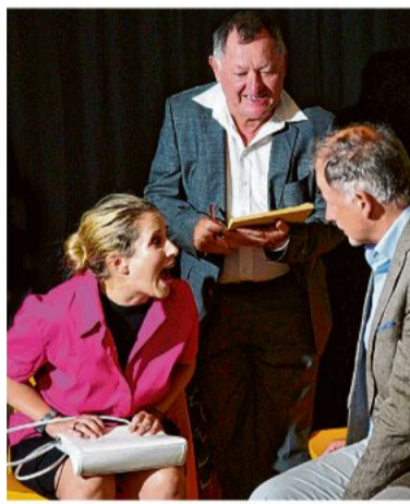
Die Stimmung beim Paartherapeuten ist eisig.

Info Karten gibt es im Vorverkauf bei der Stadtverwaltung, Telefon 0 79 35 / 707-23, und unter www.okticket.de .