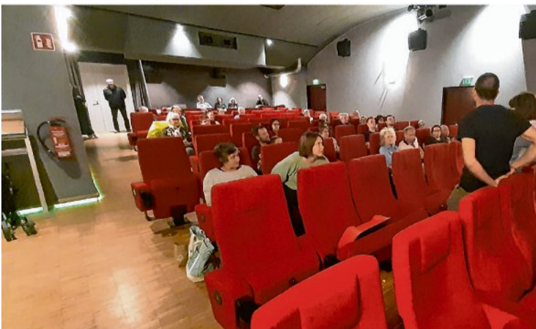
Zur aktuellen Kinoplus-Veranstaltung werden die Reihen im Lichtspielsaal nicht ganz voll.