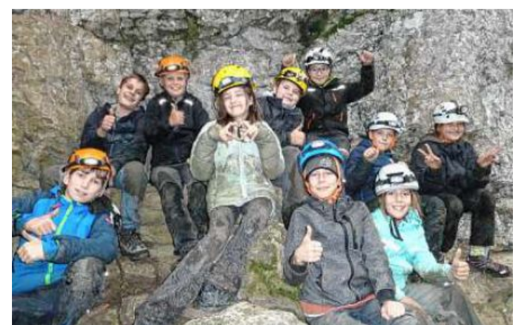
Sie sind stolz auf sich und ihre Leistung: die Teilnehmer der Exkursion der Natursport-AG.

Als am Ende Bilanz gezogen wurde, waren sich alle einig, dass es ein unvergessliches Erlebnis war, die Höhle zu erkunden und die Natur aus einer ganz neuen Perspektive zu erleben. Die Natursport-AG plant bereits weitere Aktivitäten, um das Interesse der Schüler an der Natur und deren Erhalt zu fördern: ein Vertrauenstag, das Erlernen der Kletter- und Sicherungstechnik in der Halle und am Naturfels, das Erkunden der heimischen Langlaufloipen sowie eine zweitägige Bergtour stehen noch an.