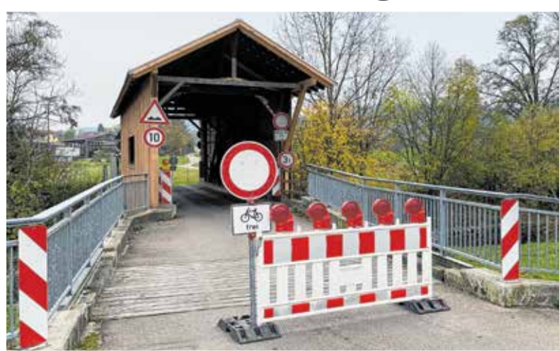
Die Holzbrücke in Kleinaltdorf ist für Pkw gesperrt.